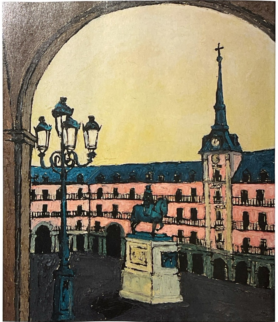
Delapiente capturó la Plaza Mayor de Madrid (1971) con colores vibrantes.

A pesar de que los especialistas siguieron teniendo presente su legado, el nombre de Fernando Delapiente (San-